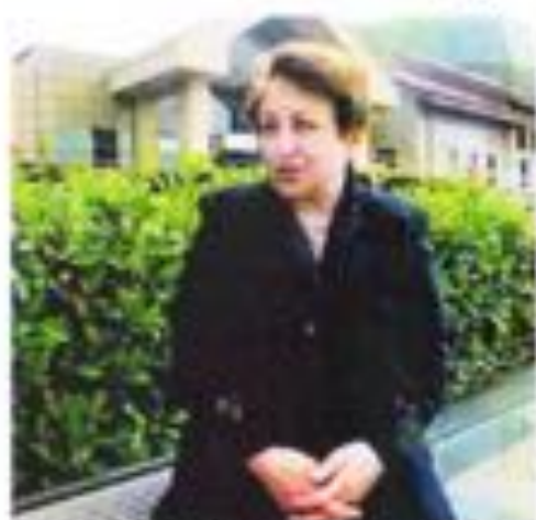
Ebadi won the Nobel in 2003 for her efforts to promote democracy and human rights.

"They had nothing to do with politics," she added. "My husband was subjected to the most intense torture. They forced my husband to appear on TV and repeat the accusations the regime has been leveling against me. At the moment my husband and my sister are free, but they have been banned from leaving the country," Ebadi said, adding that the government also confiscated all her belongings and assets.