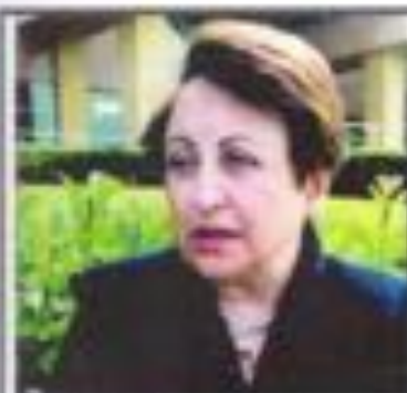
Hailing Ankara, Ebadi slams Iran for giving alleged support to Damascus